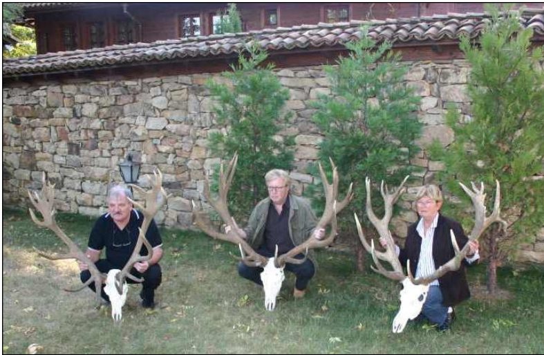
„Stolze Hirschjäger mit Ihren erbeuteten Trophäen!“