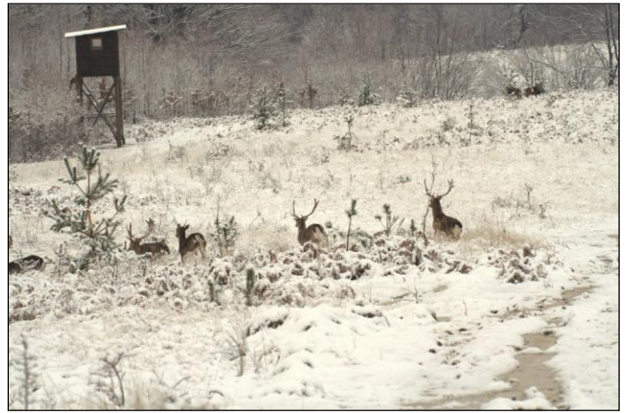
„Überall im Revier sind Wildäcker und Kanzeln vorhanden!“

Für die Bewertung wird das Geweihgewicht mit Oberkiefer, 24 Stunden nach dem abkochen gewogen. Angeschweißt und nicht gefundenes Wild wird mit 50% der gebuchten Trophäe berechnet! Für Trophäen über 200 CIC Punkte wird ein Aufschlag von 10 % auf den Preis erhoben. Abschuss Kahlwild = 100 € Abschuss Kalb = 80 € Abschuss Spießler (1 – 2 Jahre) = 150 €