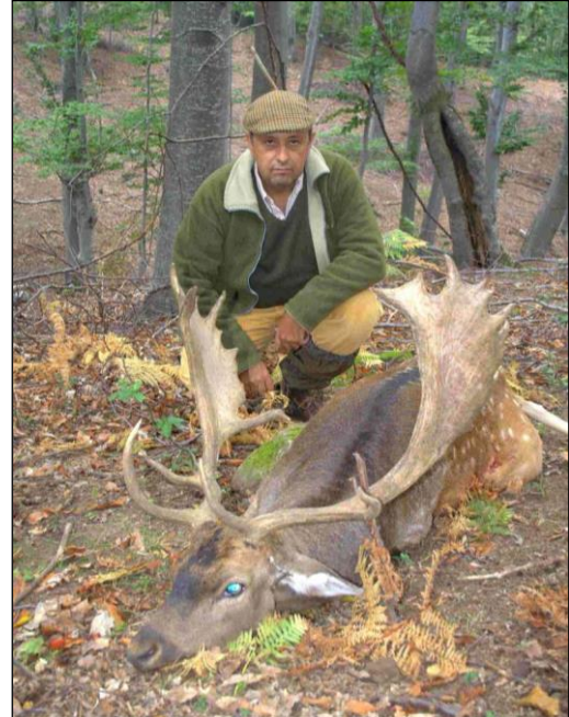
„Braver Damschaufler im im Oktober!“