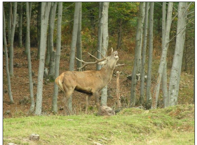
„Aufgrund der Ruhe in den Revieren brunftet das Rotwild z. T. auch tagsüber!“