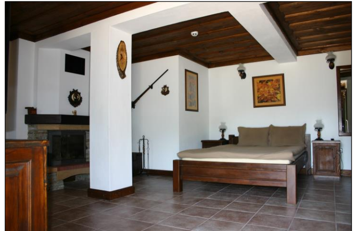
„Eines der geschmackvoll eingerichteten Zimmer!“