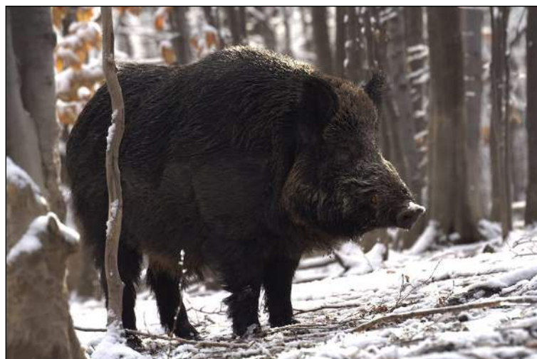
„Starke Bassen kommen sehr häufig im Revier vor!“