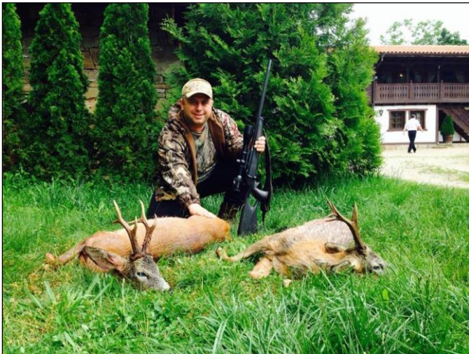
„Erfolg nach Morgenansitz und der Nachhausepirsch!“

Angeschweißt und nicht gefundenes Wild wird mit 50% der gebuchten Trophäe berechnet! Für Trophäen über 160 CIC Punkte wird ein Aufschlag von 10 % auf den Preis erhoben.