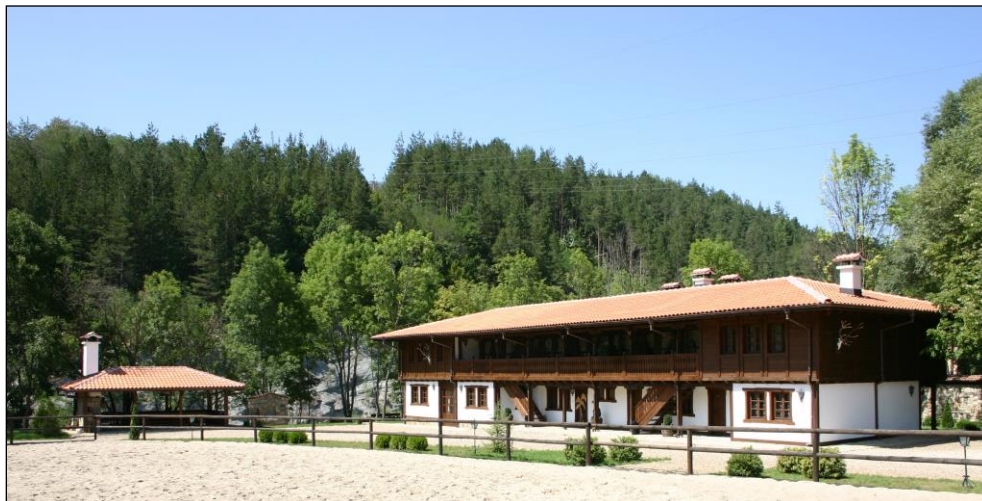
„Ein Teil der Unterkünfte im Revier!“