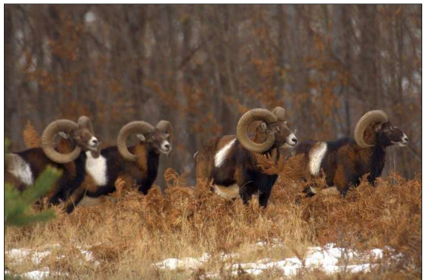
„Das Muffelwild entwickelt sich im Mittelgebirge prächtig!“