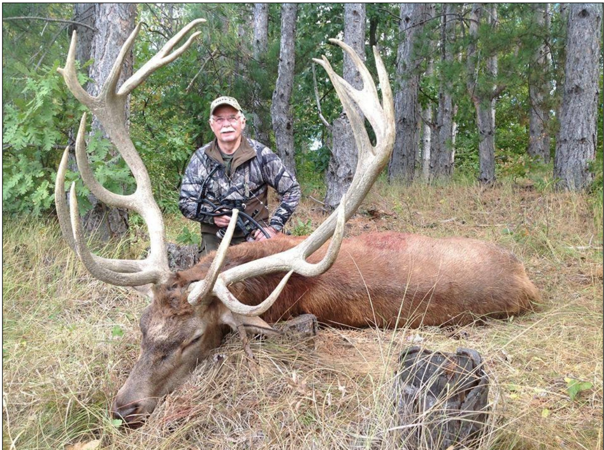
„Ein Lebenshirsch aus dem naturbelassenen Balkangebirge!“

Das gepflegte Privatrevier unseres Veranstalters befindet sich in der Mitte Bulgariens, 240 km von Sofia und 250 km von Varna entfernt. Gelegen in unmittelbarer Nähe zur Stadt aus der Epoche der bulgarischen Renaissance (Wiedergeburt) Elena, auf den Nordabhängen des Balkan- Gebirges, umfasst das Jagdgebiet das Territorium eines der ältesten Jagdreviere Bulgariens, datierend noch aus der Zaren- Zeit in Bulgarien.