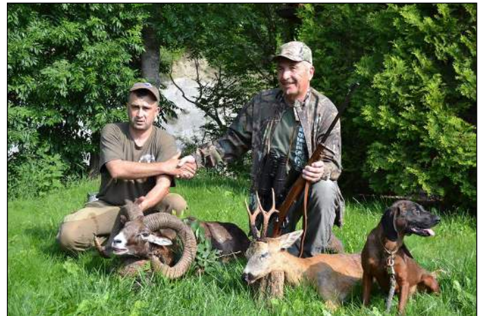
„Erfahrene Jagdhelfer sind der Garant für den Erfolg!“