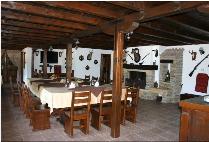
„Da lässt sich der Erfolg mit Freunden gut feiern!“

Weitere Informationen sowie detaillierte Angebote auf Anfrage! (Auch Flugangebote, evtl. Visum, Hilfe bei Waffen- und Trophäeneinfuhr) Kontaktieren Sie uns!