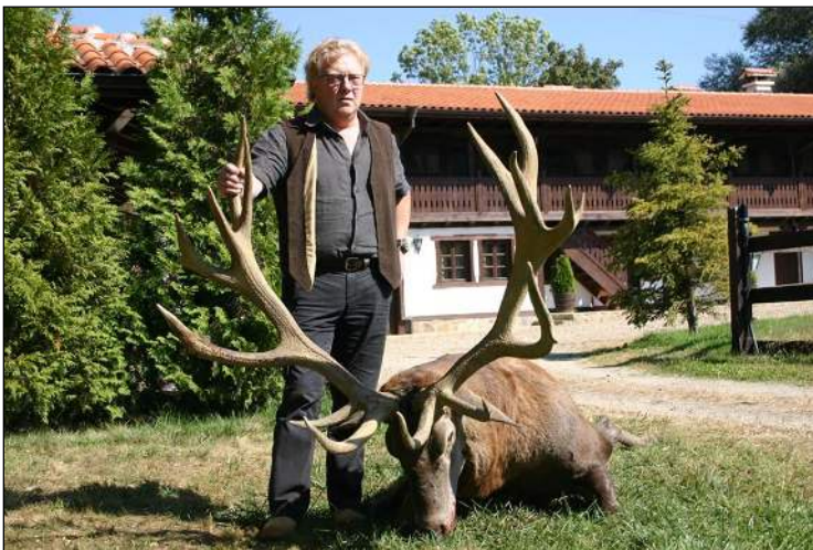
„Lohn der Hege, fast 15 kg Geweihgewicht!“

Von 2 – 4 Jahren mit Trophäengewicht bis zu 4,00 kg = 400 €