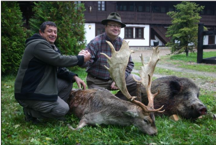
„Starker Damschaufler und Keiler an einem Morgen!“