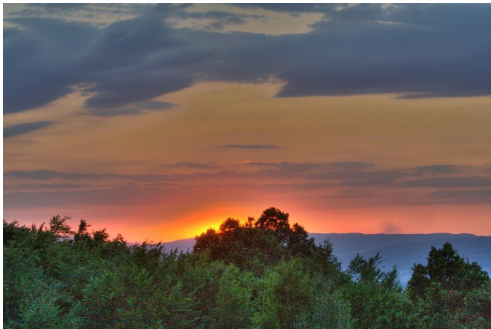
„Sonnenuntergang über dem Balkengebirge!“