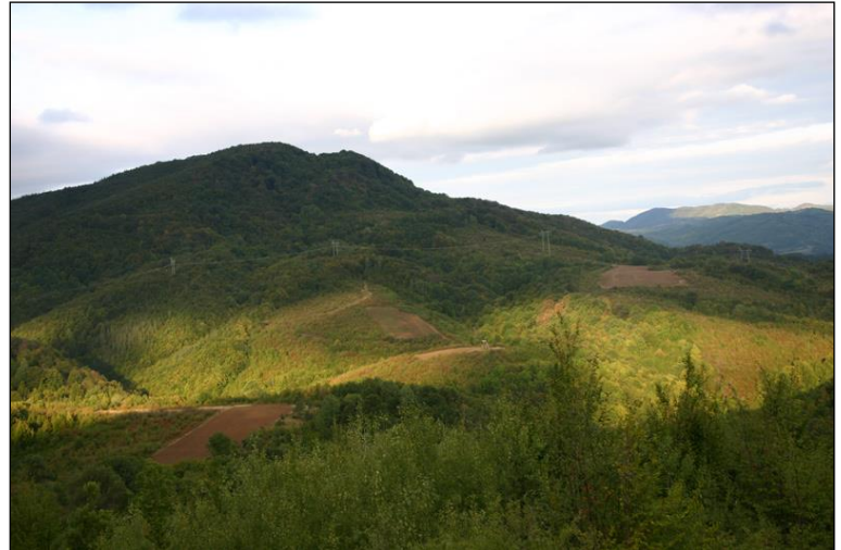
„Absolute menschenleere Bergwälder!“