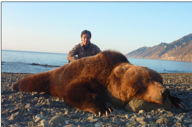
„Sobald die Küsten eisfrei werden, zieht es die Bären ans Meer!“

Die Jagd auf den Kamtschatka Braunbär ist das beste, interessanteste und traumhafteste Abenteuer für jeden richtigen Jäger. Seit 23 Jahren kann unser Veranstalter einen 95 %igen Jagderfolg vorweisen. Jedes Jahr erlegen unsere Kunden Trophäen von 280 – 290 cm und einige haben das Glück, 3-Meter-Bären zu erlegen. Das ist jetzt eher eine Seltenheit, aber solche Trophäen werden doch jedes Jahr erlegt. Die durchschnittliche Trophäengröße liegt bei 240 bis 280 cm.