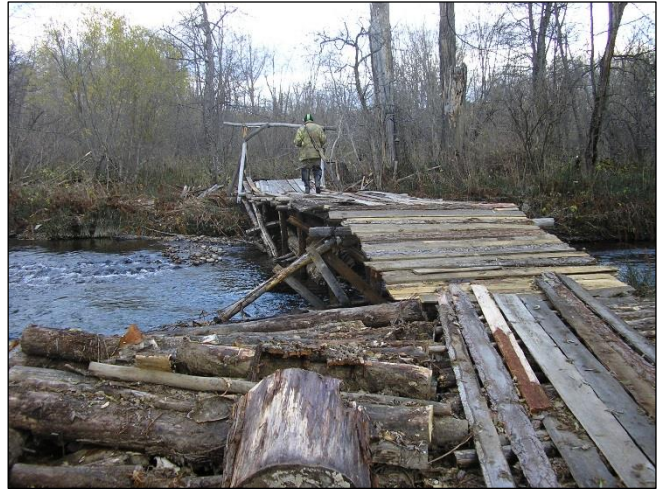
„Abenteuerliche Behelfsbrücke über einen Fluss!“