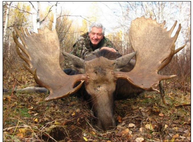
„Brave Elchschaufler aus der Winter- und Herbstjagd, erlegt nach spannender Pirsch!“