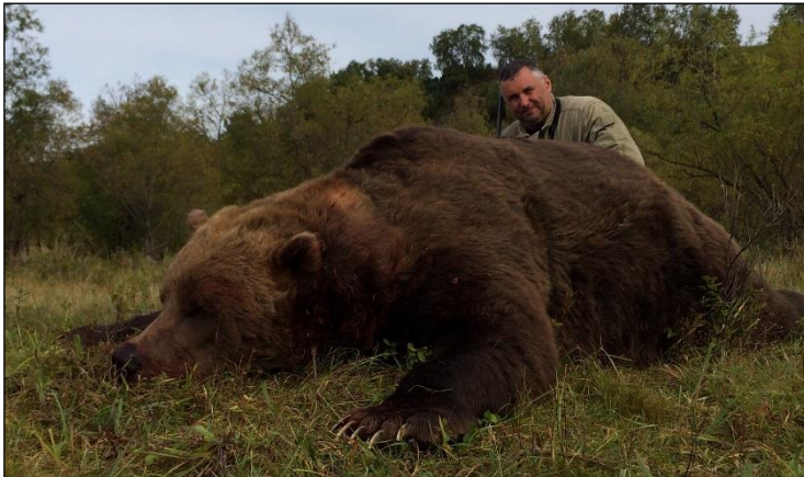
„Dieser Brocken wurde bei der Herbstjagd erlegt!“