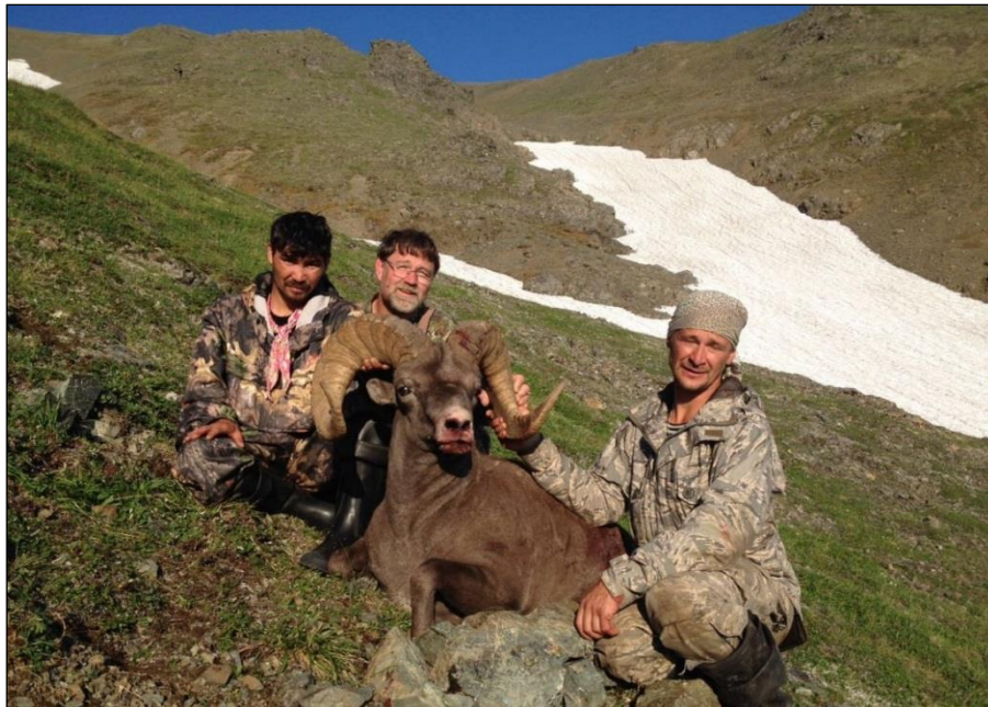
„Unser Kunde R. K., August, Schneeschat, 14 Jahre alt, 95 cm Schneckenlänge!“

1. Tag Ankunft in Moskau, Flug nach Petropavlovsk 2. Tag Ankunft in Petropavlovsk, Transfer nach Milkovo, Hotelübernachtung 3. Tag Transfer ins Jagdgebiet 4. - 13. Tag 10 volle Jagdtage 14. Tag Rücktransfer nach Milkovo, Hotelübernachtung 15. Tag Rücktransfer nach Petropavlovsk, Hotelübernachtung 16. Tag Rückflug nach Moskau, Heimflug