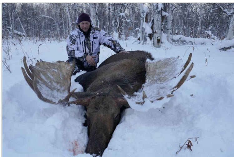
„Elchjagd im verschneiten Kamtschatka, eines der letzten Abenteuer auf dieser Welt!“