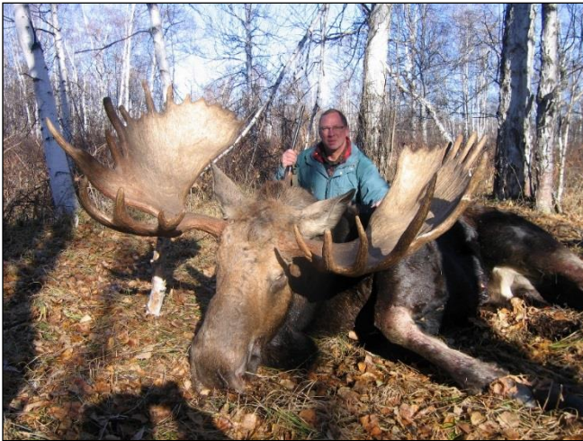
„Kapitalschaufler erlegt zur Brunft!“

Gebiet: Mittel-Kamtschatka Jagdzeit: Mitte September – Mitte Oktober, 20. November – 20. Dezember Jagdart: Quad und Schneemobil Teilnehmer: 2 Jäger pro Camp Unterkunft: Jagdhaus im Winter und Zelte im Herbst