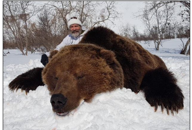
„Prächtiger Kamtschatkabär, erlegt Ende April!“