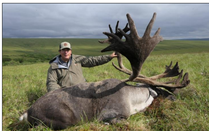
„Kapitale Karibubullen aus Alaska, erlegt am Anfang der Saison!“