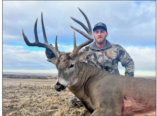
„Der Weißwedelhirsch ist eine der beliebtesten Wildarten in ganz Nordamerika!“