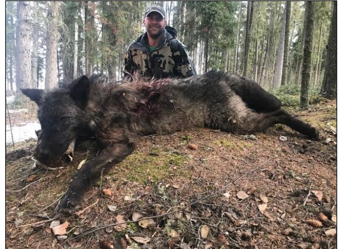
„Der Wolf kann im Winter während einer Spezialjagd und im Herbst als „Beifang“ bejagt werden!“