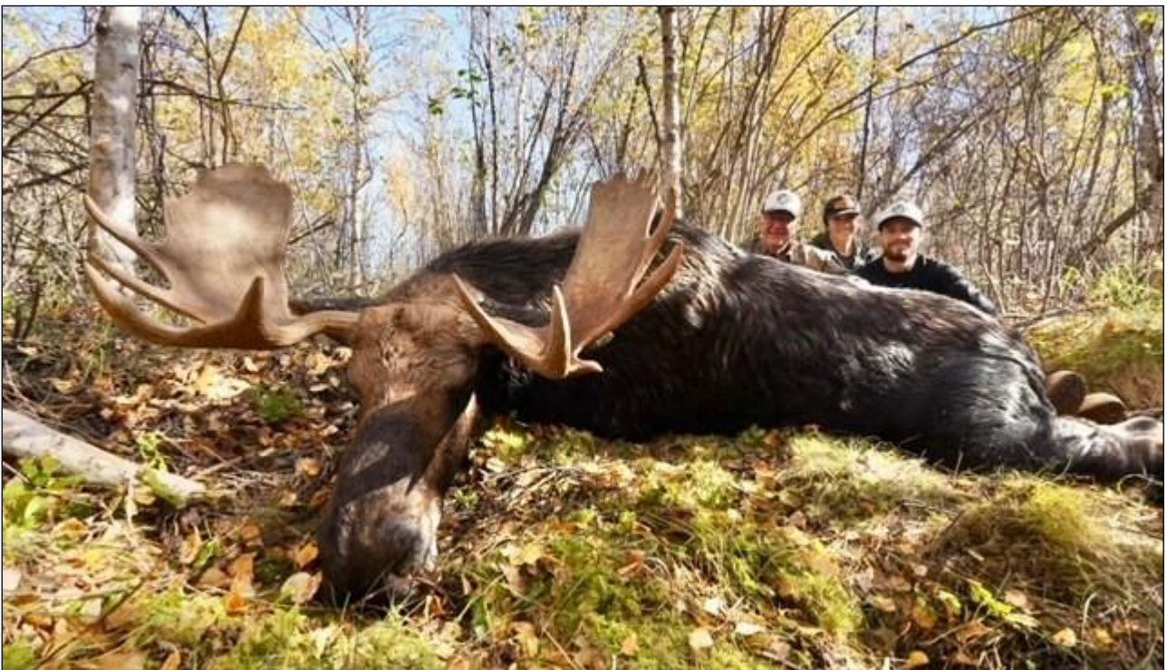
„Braver Elchschaufler erlegt im Indian Summer in Nord-Alberta!“

In den späten 1970er Jahren wurde die Firma unseres Veranstalters mit der festen Überzeugung gegründet, dass Alberta die Heimat der besten Weißwedel- und Wasservogeljagden der Welt ist. Viele Jahre später gilt dieselbe Überzeugung und wurde durch die Anzahl erfolgreicher Jagden, großer Trophäen und wiederkehrender Kunden bestätigt. Im Laufe der Jahre hat sich sein Betrieb auf Maultierhirsch-, Schwarzbären- und Elchjagden ausgeweitet. Es handelt sich um ein familiengeführtes Unternehmen. Es wird derzeit von Vater und Sohn geführt. Beide sind professionelle Guides in Vollzeit, begeisterte Jäger, Fischer und Outdoor-Männer. Sie sind stolz darauf, die besten Jagdreviere in Alberta anbieten zu können.