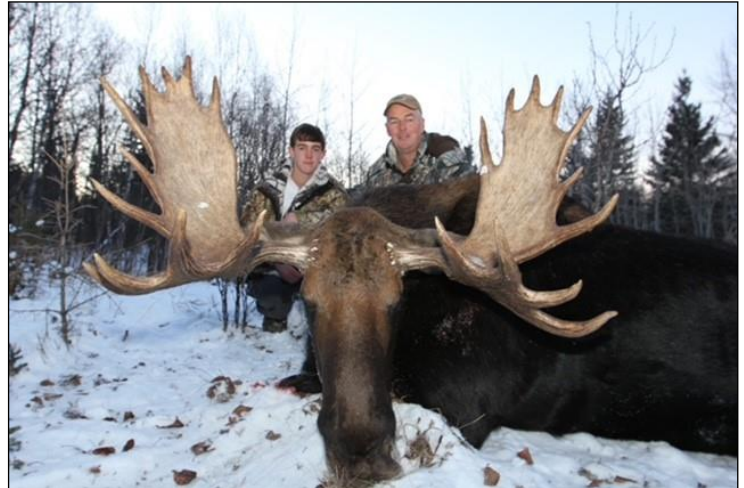
„Typische Alberta-Elche im September und Anfang Oktober erlegt!“