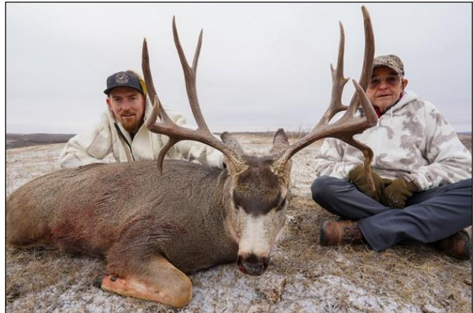
„Der Maultierhirsch erreicht hier beachtliche Trophäengrößen!“