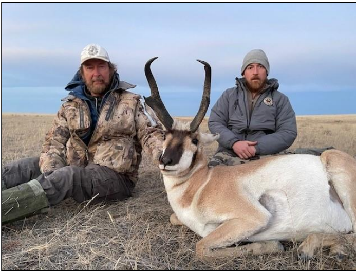
„Die Pronghornantilope wird auch Gabelbock genannt!“