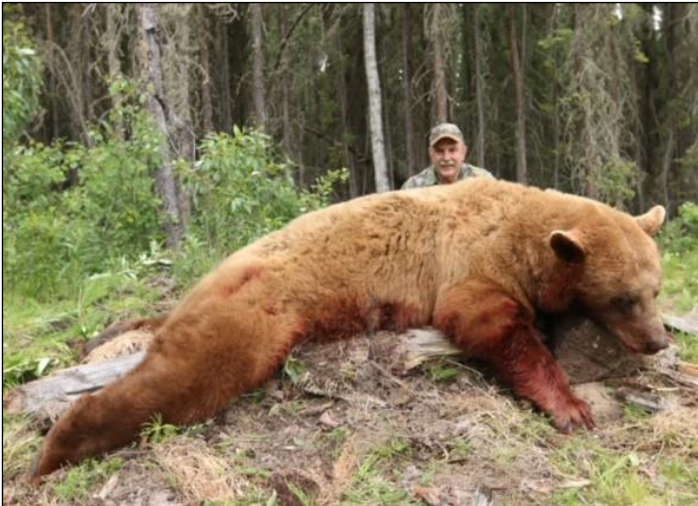
„Die Schwarzbären in Nordalberta erreichen gigantische Ausmaße! Die braune Farbvariante wird Zimtbär genannt!“