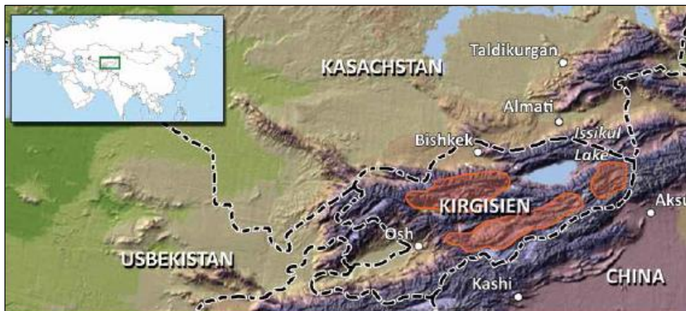
Jagdgebiete Mittelasiatischer Steinbock