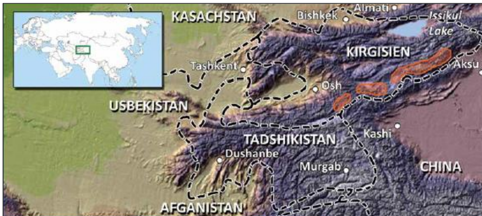
Jagdgebiete Marco Polo Argali