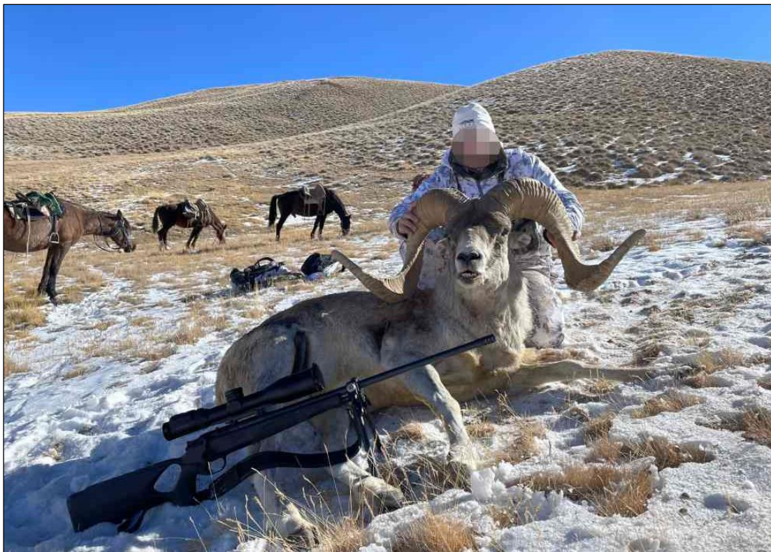
„Hier ist der Lebensraum von einem unserer Stammkunden in Erfüllung gegangen!“

Jagdgebiet: Issyk-OI Jagdart: Pferdepirsch Jagdzeit: 15. August - 30. November Teilnehmer: 1 - 3 Jäger Unterkunft: Jagdhäuser und Wohnwagen