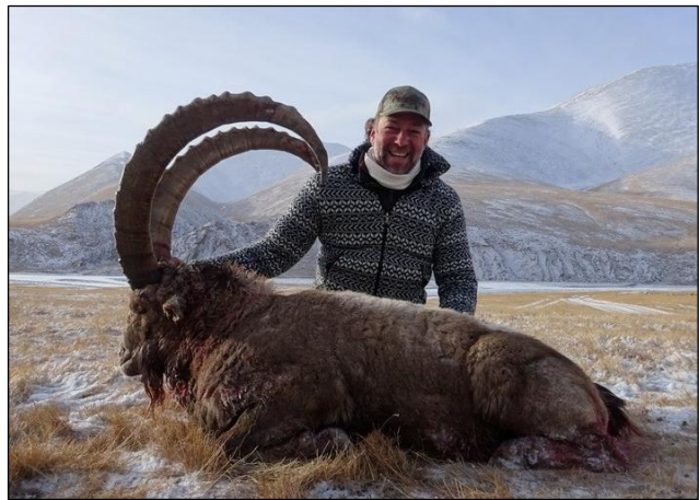
„Alter, reifer Recke – ein Jägertraum!“