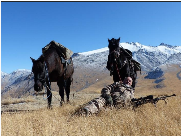
„Kurze Rast und dann geht's weiter!“

Wichtig: Schlafsack, ISO-Matte, Sonnenbrille, Seesack und Spektiv mit Stativ mitbringen!