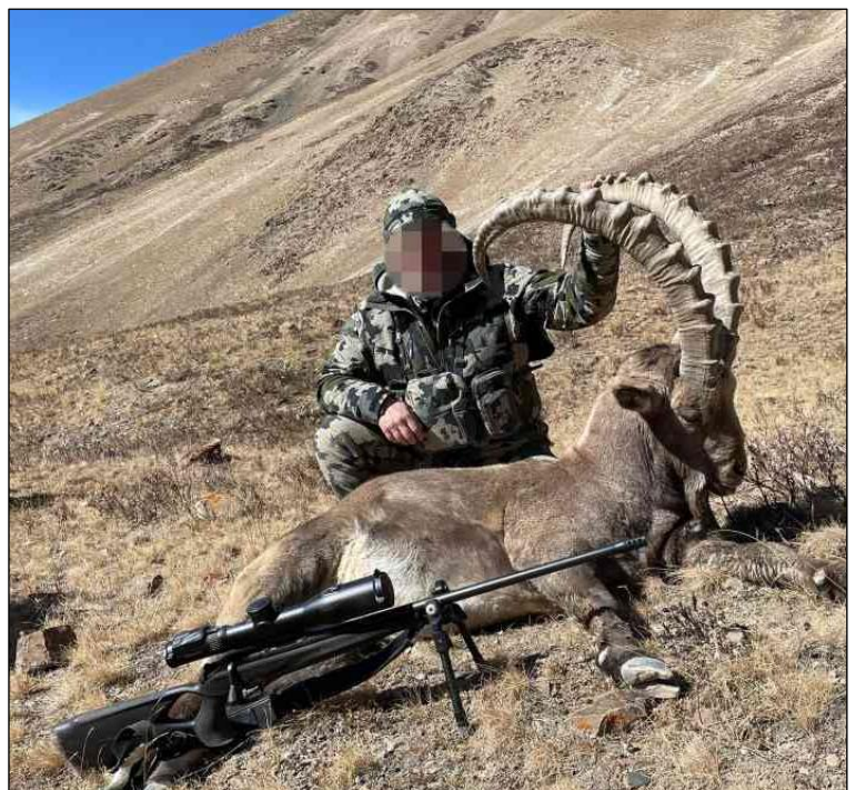
„Kirgisien ist ein sehr beliebtes Land für die Steinbockjagd!“