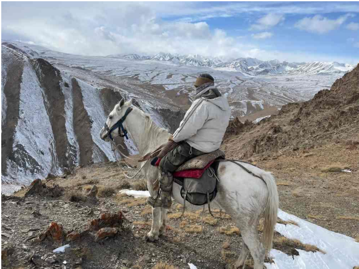
„Bei der Jagd im Hochgebirge Kirgisiens sind die Pferde zuverlässige Begleiter!“

Kirgisien ist ein sehr bekanntes Land für die Marco Polo Argali- und Steinbockjagd. Die mittlere Marco Polo Trophäenstärke liegt zwischen 45 - 50 Inches, mit einigen Trophäen bis zu 55 Inches. Es ist ein unvergessliches Abenteuer, auf einer Höhe von 3.800 – 4.000 m mit Pferden zu jagen. Der mittel-asiatische Steinbock ist der größte Steinbock der Welt und kann bis zu 50 – 55 Inches erreichen.