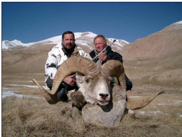
„Marco Polo-Argali – begehrt bei jedem Bergjäger!“

In der Regel ist das Wetter gut und mehr oder weniger voraussagbar während der Jagdsaison. Die durchschnittliche Tagestemperatur im Oktober beträgt +5 bis +15°C und in der Nacht von -5 bis -10°C. Im November wird es kälter: am Tag von -10 bis -15°C und in der Nacht von -15 bis -20°C. Es kann auch sehr windig sein.