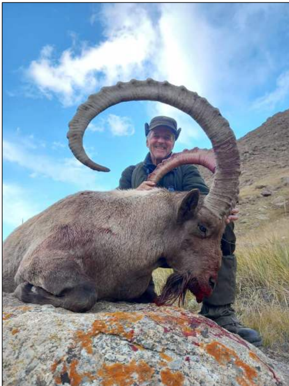
„Rekordsteinbock mit 138 cm Schlauchlänge!“