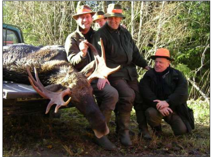
„Über diesen Drückjagdelch freut man sich mit seinen Freunden!“