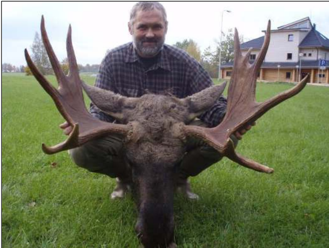
„Brave Elchrophäe, erlegt in der Brunft!“