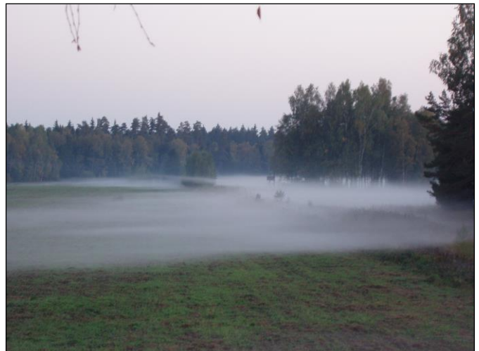
„Morgennebel über dem Brunftplatz!“