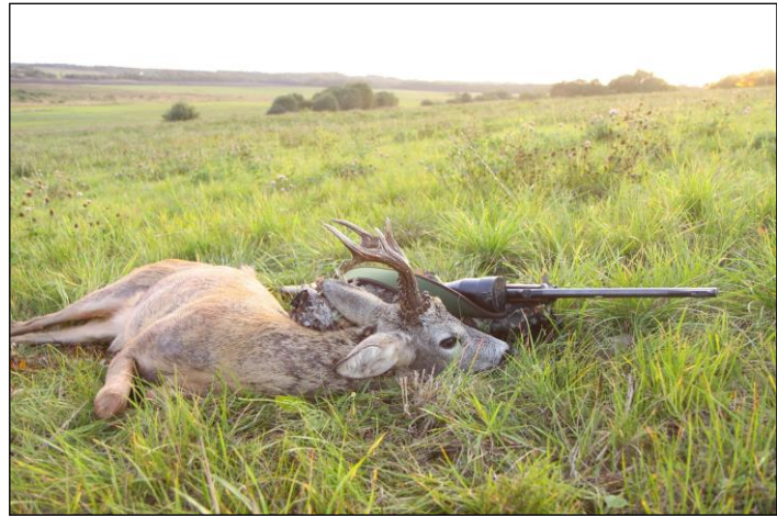
„Unter deutschen Jägern ist wenig bekannt, dass in Lettland auch gute Böcke vorkommen!“