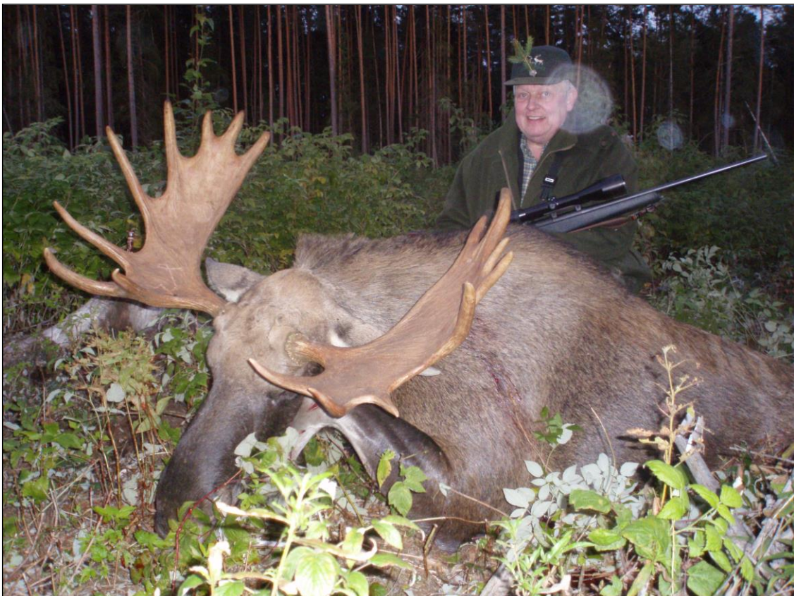
„Dieser stattliche Elchschaufler kann sich sehen lassen!“

Seit Anfang der 90er Jahre bietet der staatliche Veranstalter (Forstministerium) Ihnen die Jagdmöglichkeiten in den besten Staatsjagdrevieren. Die Hauptwildarten sind Rothirsch, Elch, Schwarzwild und Rehböcke. Ebenfalls gibt es einen guten Bestand an Auer- und Birkhähnen. Niederwild (Enten und Gänse) sowie Raubwild (bei guter Schneelage wird auch die Lappjagd auf Wölfe durchgeführt!) kann ebenfalls mitbejagt werden.