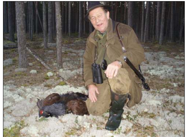
„Der Auerhahn in Lettland kann nur noch im Herbst oder Winter bejagt werden!“