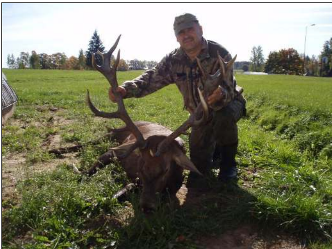
„Stolz präsentiert der Jagdführer den gestreckten Hirsch!“