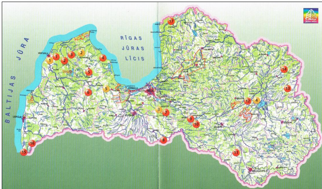
„Die Staats-Jagdreviere Lettlands!“

Die Republik Lettland liegt am Baltischen Meer und nimmt ein Territorium von 65.000 km 2 ein. Fast die Hälfte davon - 27.000 km 2 - ist mit Wald bedeckt. Lettland ist schon immer wegen einer artenreichen Fauna berühmt gewesen. Durch günstige Boden- und Klimaverhältnisse und gezielte Hegemaßnahmen entwickelt sich ständig die Vielzahl der jagdbaren Tiere.