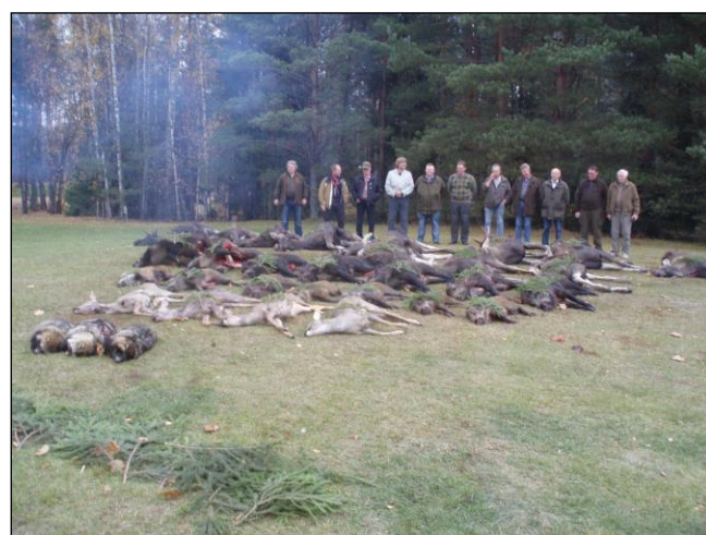
„Gemischte Strecke einer unserer Jagdgruppen!“