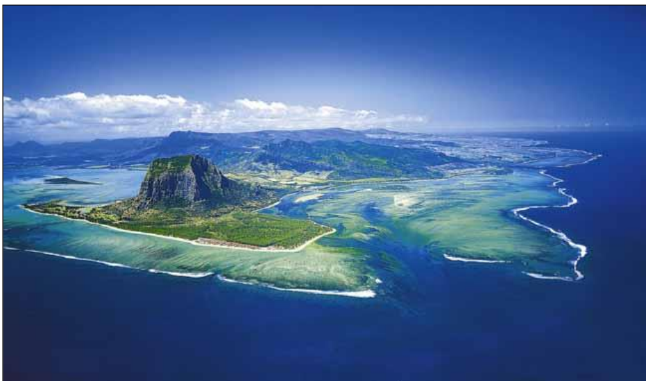
„Kombination: Jagd & Urlaub an traumhaften Stränden!“