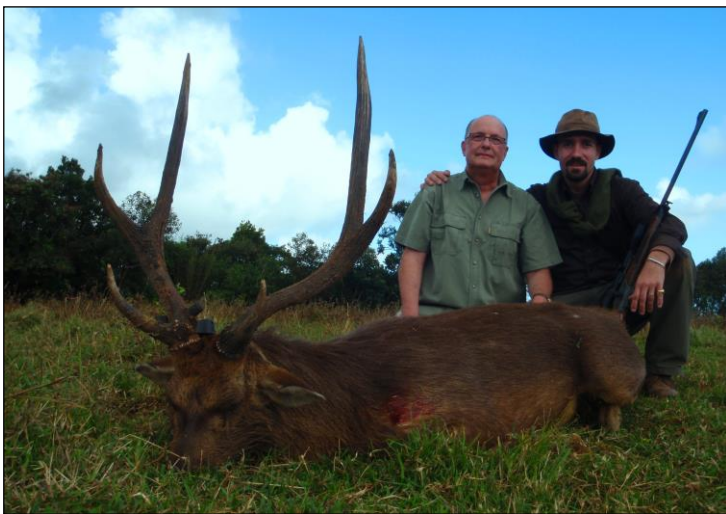
„Der Java-Rusahirsch wird auch Mähnenhirsch genannt!“