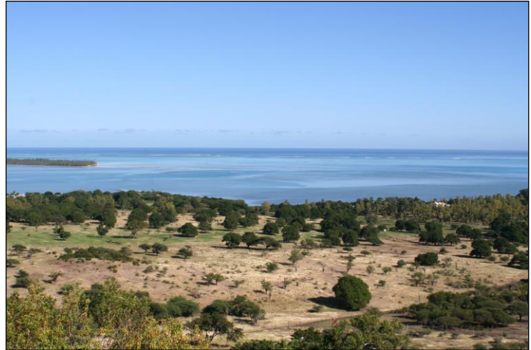
„Herrlicher Ausblick auf den Indischen Ozean!“