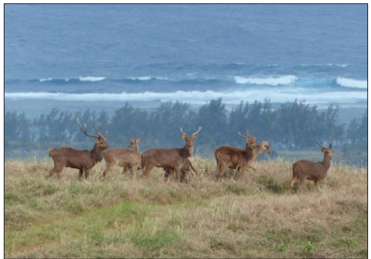
„Das Brunftrudel wurde von den Jägern angepirscht!“