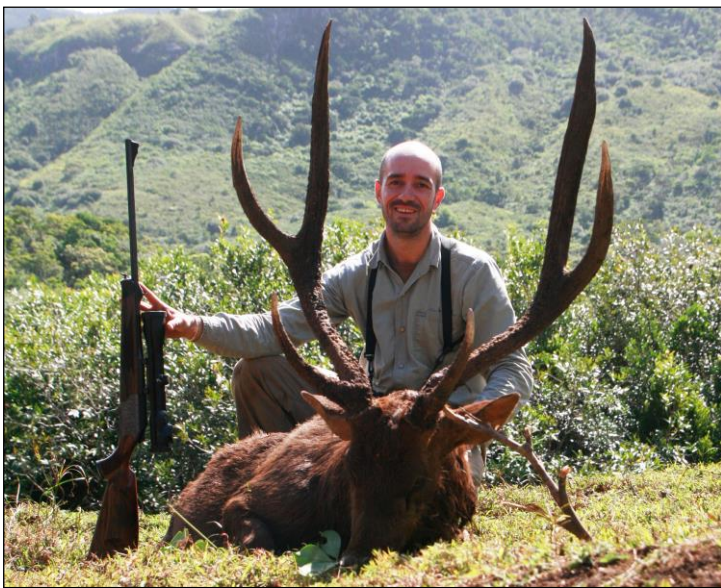
„Kapitalhirsch in bergiger Kulisse!“

Sämtliche sonstigen für die bestätigte Buchung angefallenen Kosten (z.B. Flugarrangement) werden bei Stornierung in Höhe ihres Anfalls berechnet. Die Vermittlungsgebühr der Firma Dr. Lechner Profi-Jagdreisen ist im Falle einer Stornierung generell fällig.