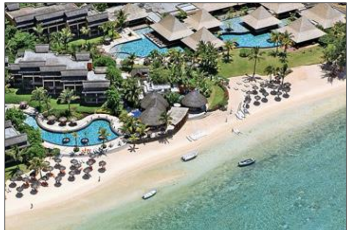
„Exklusive Hotels, weiße Sandstrände und türkisfarbenes Meer sind das Urlaubsparadies!“