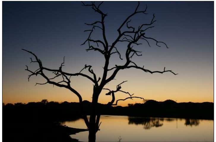
„Sonnenaufgang, ein neuer Jagdtag beginnt!“