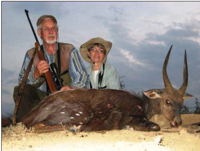
„Guter Buschbock, erlegt nach spannender Pirsch!“