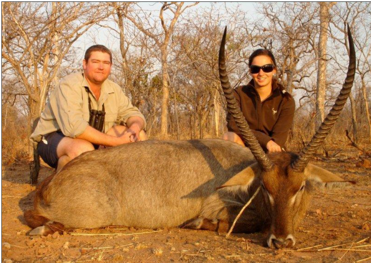
„Der Wasserbock ist eine Charakterwildart Afrikas!“

Unser Veranstalter leitet das älteste und erfahrenste Safari-Unternehmen Simbawes, gegründet 1979. Er jagt auf seiner eigenen Farm, der Lebonka Lodge, im Marula district. Die Unterbringung erfolgt in einem hervorragend ausgestatteten Camp mitten im Jagdgebiet. Jedes der fünf aus Naturstein gebauten und mit Ried gedeckten Chalets hat ein eigenes Bad. Zur Entspannung steht ein Swimmingpool sowie eine Bar zur Verfügung. Im Camp ist permanent 220 Volt Strom. Die Safari beginnt und endet mit der Ankunft in Bulawayo.