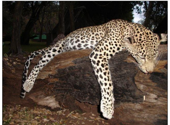
„Leopard im letzten Büchsenlicht gestreckt!“