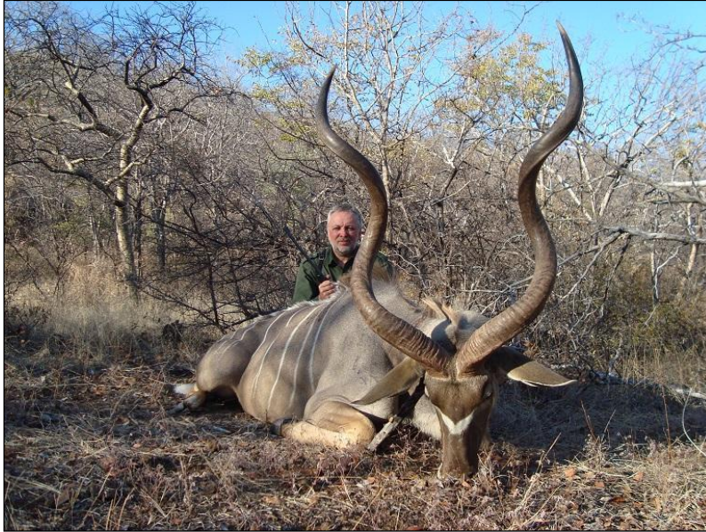
„Der große Kudu wird auch 'der graue Geist' Afrikas genannt!“