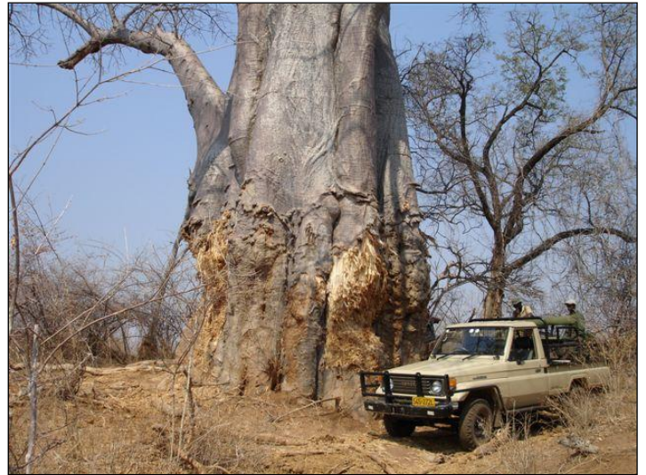
„Kurze Rast im Schatten eines uralten Baobab!“