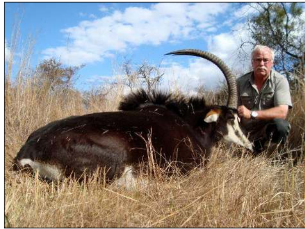
„Eland uns Sable, zwei begehrte Großantilopen!“