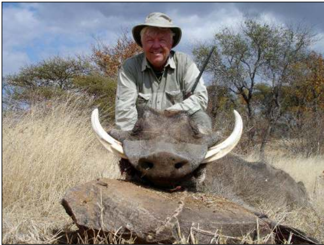
„Warzenkeiler erlegt kurz vor der Regenzeit!“