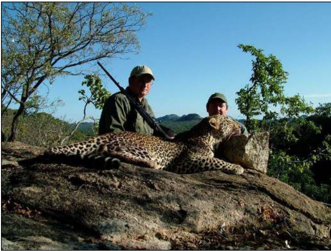
„Die Erfolgsquote auf Leopard ist bei unserem Veranstalter besonders hoch!“

Wir empfehlen daher dringend den Abschluss einer Reiserücktrittskosten-Versicherung!