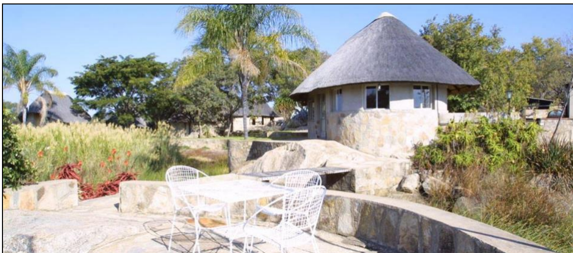
„Hier schmeckt der Sun Downer besonders lecker!“

Preis- und Programmänderungen vorbehalten